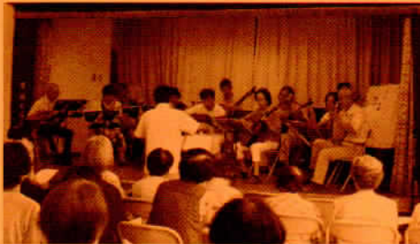
出前演奏 (ふれあいサロン原)