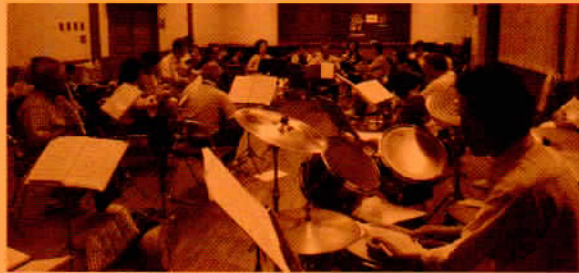
夏期合宿練習 (川口・山の家)