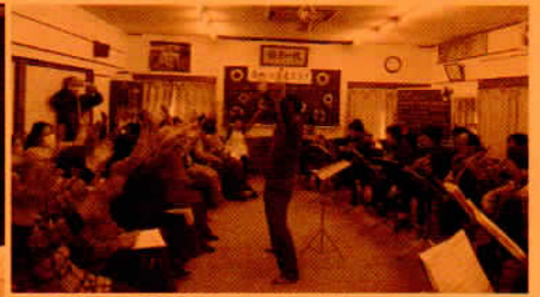
出前演奏 (南町ふれあいサロン)