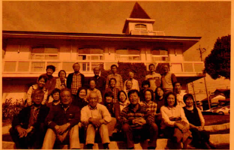
強化練習 (かなや会館)