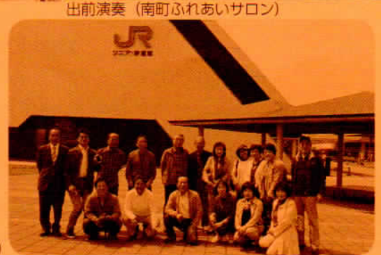
親睦旅行 (リニア・鉄道館)